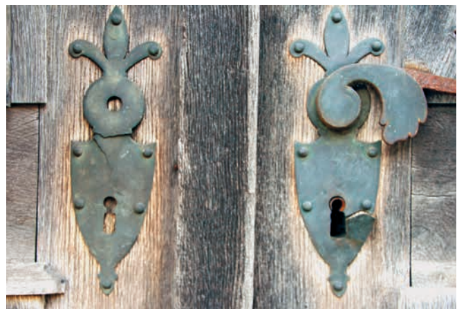
Abb. 4: Biedermeier Drücker- und Türschild am Eichenportal; Foto vom Mai 2013.

Beginnen wir mit unserer ersten Inaugenscheinnahme der Gebäude im Zustand, der sich vor der Renovation bot. Die Hofstätte «Alte Post», nach der letzten Bewohnerfamilie auch als «Hofstätte Hagenhaus» 13 bezeichnet, umfasst ein Doppelwohnhaus, eine Stallscheune, das Waschhaus und das Schützenhäuschen. Die vier Baukörper stehen frei für sich, sind aber klar ersichtlich als Ensemble angeordnet. Das Stallgebäude ist nicht, wie bei unseren Bauernhäusern üblich, 14 mit dem Wohnhaus verbunden, sondern wurde – wie bei Gebäuden des Adels 15 – in gebührendem Abstand davon errichtet. Dies kann als erster Hinweis auf den bürgerlichen Anspruch gedeutet werden, welchen diese Hofstätte ausstrahlen sollte. Auch wenn der Abstand zwischen Wohnhaus und Stallgebäude nur wenige Meter beträgt, sollte diese zum Ausdruck bringen, dass hier zwar eine damals auf dem Lande überlebenswichtige Landwirtschaft betrieben wird, zu der man sich aber auf Distanz hält. Dies sollte