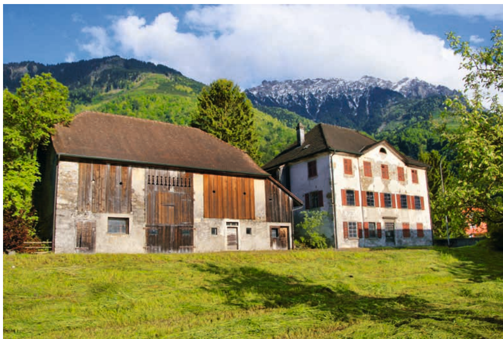
Abb. 2: Wohnhaus und Stallgebäude, von der Feldkircher Strasse aus gesehen; Foto vom Mai 2013.