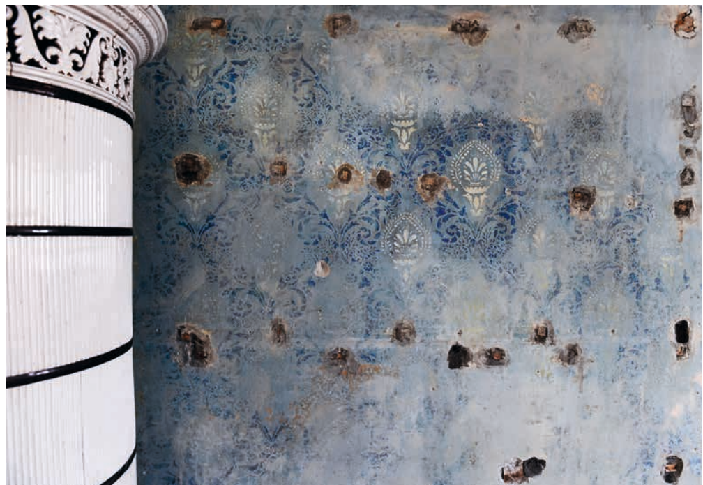
Abb. 12: Zylinderkachelofen und Wandmalereien nach der Freilegung im blauen Salon; Foto vom 23. März 2023.

Seit den 1950er-Jahren, in der Phase des explosionshaften wirtschaftlichen Aufschwungs, wurden 400 historisch relevante Gebäude in Liechtenstein abgerissen. Ein Ende der Abrissepidemie ist nicht abzusehen. Das, was