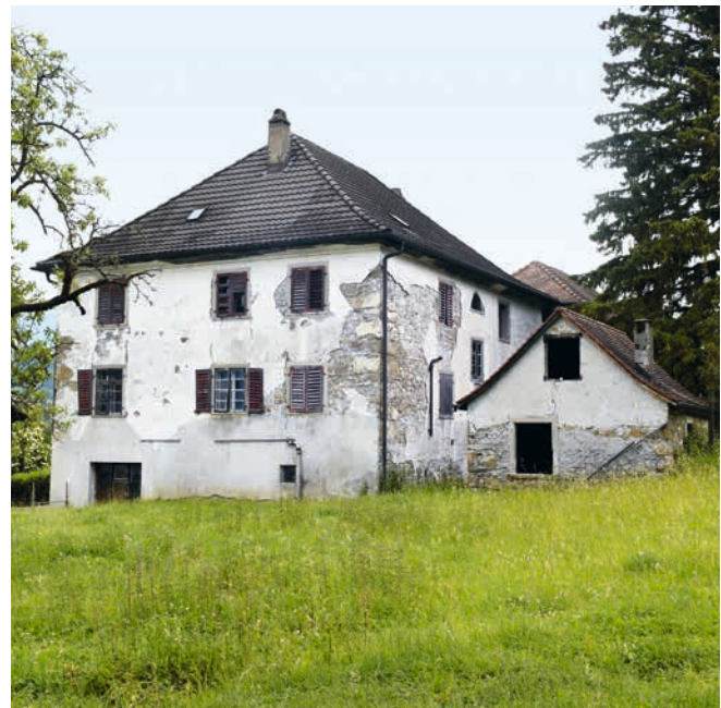
Abb. 1: Südostansicht des Wohnhauses; Foto vom Juni 2021.